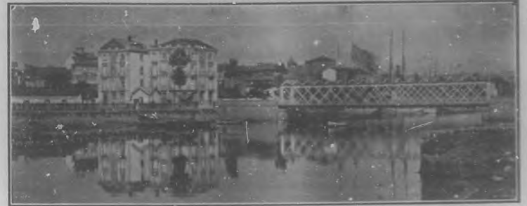
PUENTE DE SAN SEBASTIAN MODERNO.-AVILES

BOHEMIA, publica en esta edición con la repro- ducción de unos de los aparatos más modernos en el mundo, y de brillante confección ha en pro de las artes gráficas en Cuba. Nuestros plácemes