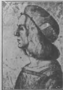
Zanobi del Giocondo Marido de Monna Lisa "La Gioconda".—Dibujo de Leonardo Vinci de la colección Uffizi.

¿Que no?... ¿Quiere el lector, y especialmente la lectora, convencerse del peligro que ofrece el prodigarse fotográficamente?