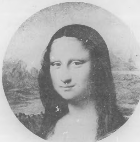
"LA MONNA LISA"

Pues vea lo hecho con la dulce Gioconda. El arte y la fotografía la han puesto sombrero, vestido de última moda, sombrilla, bolsa: la han calzado... y la han hecho pasear por los más concurridos lugares de París.