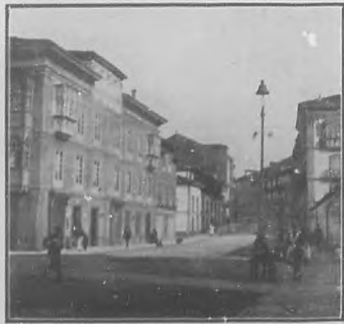
CALLE DE LA CÁRCEL.-AVILES

BOHEMIA, publica en esta edición con la repro- ducción de unos de los aparatos más modernos en el mundo, y de brillante confección ha en pro de las artes gráficas en Cuba. Nuestros plácemes