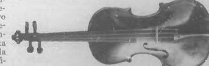
Stradivarius que usó el genial violinista Brindis de Salas y que actualmente está á la venta en un rastro de la ciudad de Buenos Aires.