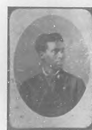
Brindis de Salas en 1879.