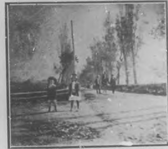
AVILES BALLINIELLO.-LA CARRETERA