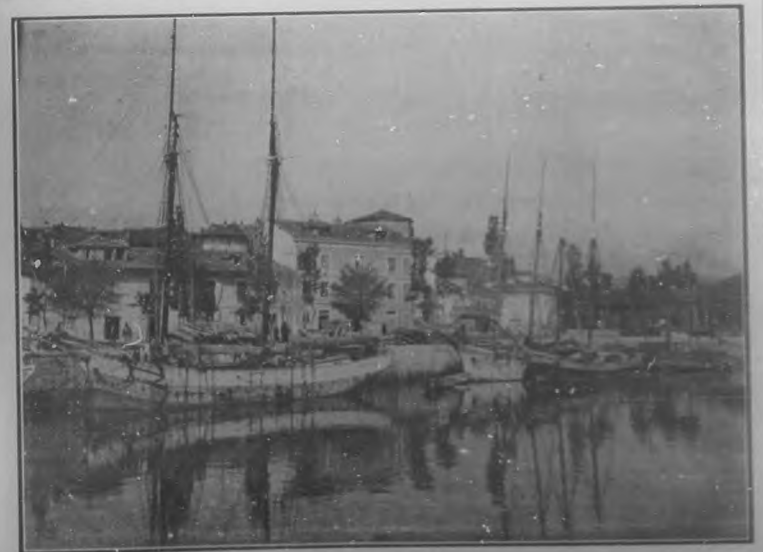
RÍA DE AVILES