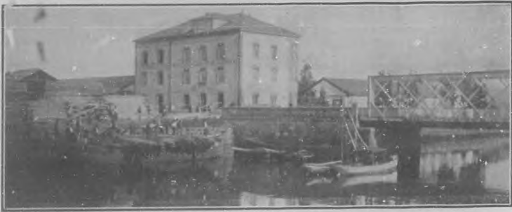
RÍA DE AVILÉS